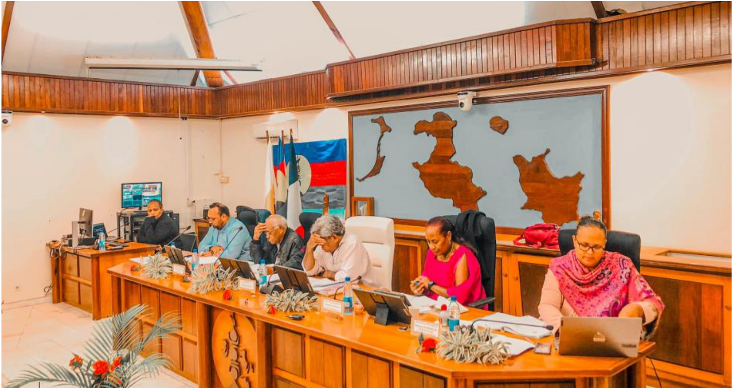
Assemblée de la Province des Îles Loyauté, jeudi 29 juin 2023.